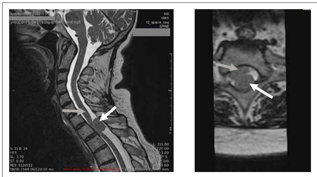
Abbildung 1: Patientin der Kasuistik 1: Präoperatives MRI Mitte Februar 2017 von parasagittal und transversal in T2-Wichtung im Bereich des spinalen Meningeoms. Der weisse Pfeil markiert jeweils den Tumor, der graue das Rückenmark.

mittel gehen. Es bestanden keine Blasen- und/oder Mastdarmfunktionsstörungen. Sie klagte über Schmerzen in der linken Schulter, vor allem bei Bewegung beziehungsweise Belastung.